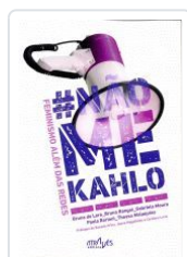
# NAO ME KAHLO.FEMINISMO ALEM DAS REDES VV.AA.