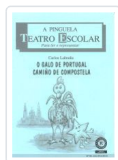
O GALO DE PORTUGAL CAMIÑO DE COMPOSTELA. A PINGUELA 86 CARLOS LABRAÑA