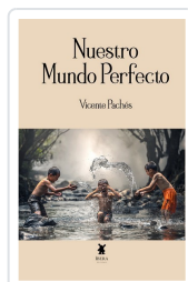
NUESTRO MUNDO PERFECTO VICENTE PACHÉS MARTINEZ