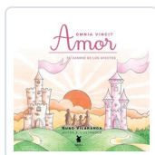
OMNIA VINCIT. AMOR EL CAMINO DE LOS AFECTOS NUNO VILARANDA