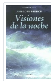
39. VISIONES DE LA NOCHE AMBROSE BIERCE