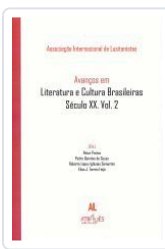
AVANÇOS EM LITERATURA E CULTURA BRASILEIRAS.SECULO XX.VOL.2 ASSOCIAÇÃO INTERNACIONAL DE LUSITANISTAS