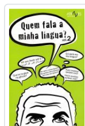
QUEM FALA A MINHA LINGUA? VOL.2 VV.AA.