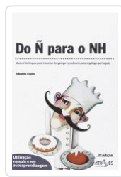
DO Ñ PARA O NH (2ªED) VALENTIM FAGIM