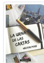
LA URNA DE LAS CARTAS HÉCTOR POSE PORTO