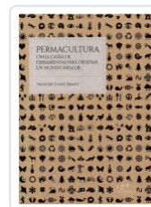
PERMACULTURA ALEXANDRE GRANDE BABARRO