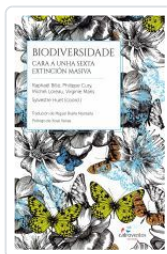
BIODIVERSIDADE. CARA A UNHA SEXTA EXTINCION MASIVA RAPHAEL BILLE;PHILIPPE CURY;MICHEL LOREA