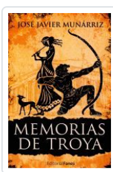
MEMORIAS DE TROYA JOSE JAVIER MUNARRIZ