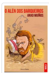
O ALÉN DOS BARQUEIROS ANXO MUIÑOS