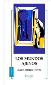
LOS MUNDOS AJENOS ISABEL BLANCO-RIVAS