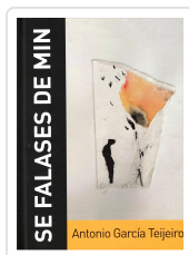
SE FALASES DE MIN (INCL.CD) ANTONIO GARCÍA TEJEIRO