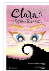
CLARA Y EL RAPTO DE LA PUESTA DE SOL JOSE JULIO FERNANDEZ; ENRIQUE LOPEZ (ILU.)