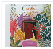
O XARDÍN DAS SETE PORTAS CONCHA CASTROVIEJO