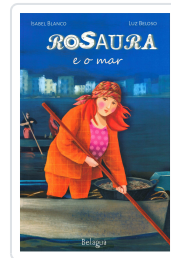
ROSAURA E O MAR ISABEL BLANCO