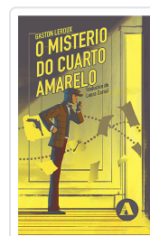
O MISTERIO DO CUARTO AMARELO LEROUX, GASTON