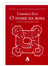
O NOME DA ROSA ECO, UMBERTO