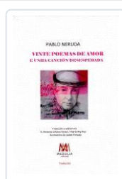
VINTE POEMAS DE AMOR E UNHA CANCIÓN DESESPERADA PABLO NERUDA