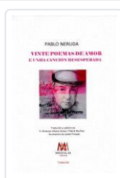
VINTE POEMAS DE AMOR E UNHA CANCIÓN DESESPERADA PABLO NERUDA