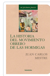
LA HISTORIA DEL MOVIMIENTO OBRERO DE LAS HORMIGAS JUAN CARLOS MESTRE