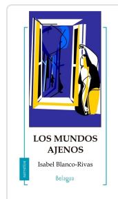
LOS MUNDOS AJENOS ISABEL BLANCO-RIVAS