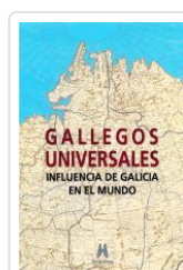
GALLEGOS UNIVERSALES VV.AA.; ALFONSO EIRE (COORD.)