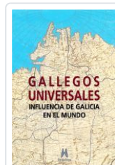
GALLEGOS UNIVERSALES VV.AA.:ALFONSO EIRE(COORD.)