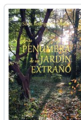
EN LA PENUMBRA DE UN JARDÍN EXTRAÑO SILVIA RODRÍGUEZ COLADAS