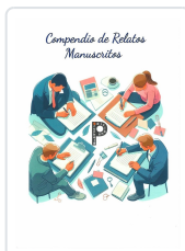
COMPENDIO DE RELATOS MANUSCRITOS VV.AA.