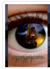
A LINGUAXE CORSARIA ANXO MUÍÑOS