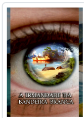
A IRMANDADE DA BANDEIRA BRANCA ANXO MUÍÑOS