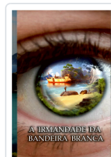
A IRMANDADE DA BANDEIRA BRANCA ANXO MUIÑOS