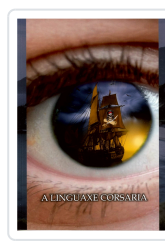
A LINGUAXE CORSARIA ANXO MUÍÑOS