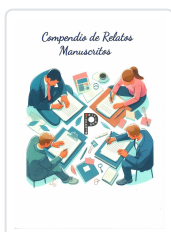
COMPENDIO DE RELATOS MANUSCRITOS VV.AA.