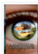
A IRMANDADE DA BANDEIRA BRANCA ANXO MUÍÑOS