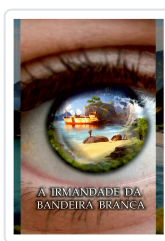
A IRMANDADE DA BANDEIRA BRANCA ANXO MUÍÑOS