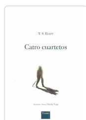
CATRO CUARTETOS T.S. ELIOT