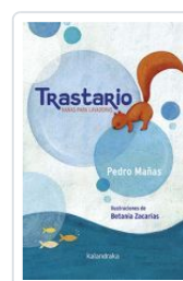
TRASTARIO.NANAS PARA LAVADORAS PEDRO MAÑAS; BETANIA ZACARIAS(ILU.)