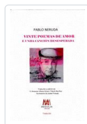
VINTE POEMAS DE AMOR E UNHA CANCIÓN DESESPERADA PABLO NERUDA