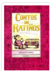
CONTOS DE RATIÑOS ARNOLD LOBEL