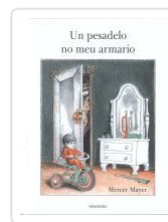
UN PESADELO NO MEU ARMARIO MAYER, MERCER