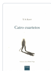
CATRO CUARTETOS T.S. ELIOT