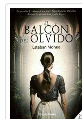
EL BALCÓN DEL OLVIDO ESTEBAN MONEO