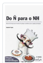
DO Ñ PARA O NH (2ªED) VALENTIM FAGIM