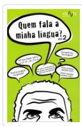
QUEM FALA A MINHA LINGUA? VOL.2 VV.AA.