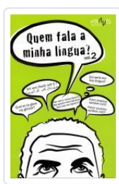
QUEM FALA A MINHA LINGUA? VOL.2 VV.AA.