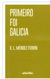
PRIMEIRO FOI GALICIA X. L. MÉNDEZ FERRÍN