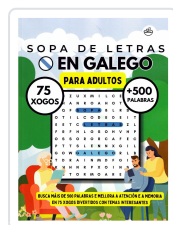
SOPA DE LETRAS EN GALEGO (PARA ADULTOS) BREIXO MARIÑO