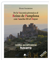
DE LA VASCONIA PIRENAICA AL REINO DE PAMPLONA CON SANCHO III EL MAYOR INAKI SAGREDO