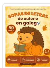
SOPAS DE LETRAS DO OUTONO EN GALEGO DE 7 A 8 ANOS BREIXO MARIÑO MALVIDO