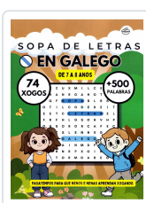
SOPA DE LETRAS EN GALEGO (DE 7 A 8 ANOS) BREIXO MARIÑO