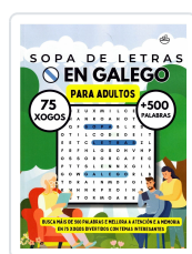
SOPA DE LETRAS EN GALEGO (PARA ADULTOS) BREIXO MARIÑO