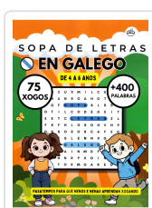
SOPA DE LETRAS EN GALEGO (DE 4 A 6 ANOS) BREIXO MARIÑO