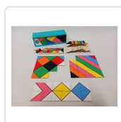
XEOMETRÍAS (+3 ANOS/ + ANOS) BRAZOLINDA