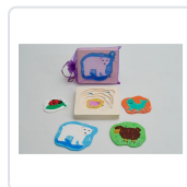
OSO PUZZLE ENCAIXABLE (+1 ANO) BRAZOLINDA