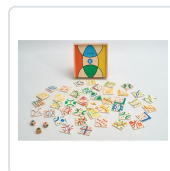
O AGASALLO (+3 ANOS/ SEN LIMITE DE PERSOAS) BRAZOLINDA