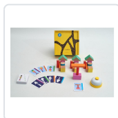
A CABANA (+3 ANOS/ 1-4 PERSOAS) BRAZOLINDA