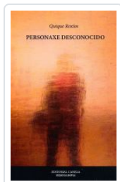
PERSONAXE DESCONOCIDO QUIQUE ROXIOS