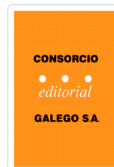
EL MARISCAL PARDO DE CELA PARDO DE GUEVARA, EDUARDO 10,58