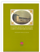
O ANTIGO HOSPITAL DE ESTEIRO CAMPUS UNIVERSITARIO DE FERROL JOSE RAMON SORALUCE BLOND