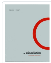
ANALISE SOCIOLINGUISTICA DA UNIVERSIDADE DA CORUÑA ANTON ALVAREZ SOUSA