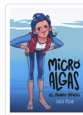
MICRO ALGAS. EL MUNDO OCULTO XULIA PISON