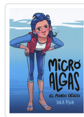
MICRO ALGAS. EL MUNDO OCULTO XULIA PISON