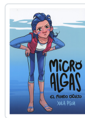
MICRO ALGAS. EL MUNDO OCULTO XULIA PISON