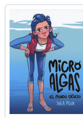
MICRO ALGAS. EL MUNDO OCULTO XULIA PISON