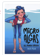
MICRO ALGAS. EL MUNDO OCULTO XULIA PISON