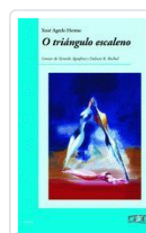
O TRIANGULO ESCALENO XOSE AGRELO HERMO