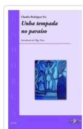
UNHA TEMPADA NO PARAISO CLAUDIO RODRIGUEZ FER