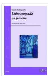
UNHA TEMPADA NO PARAISO CLAUDIO RODRIGUEZ FER