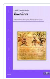
BUCOLICAS PUBLIO VIRXILIO MARON