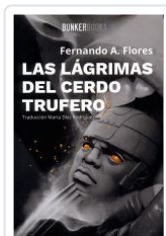
LAS LÁGRIMAS DEL CERDO TRUFERO FERNANDO A.FLORES