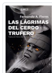
LAS LAGRIMAS DEL CERDO TRUFERO FERNANDO A.FLORES