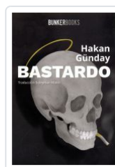
BASTARDO HAKAN GUNDAY