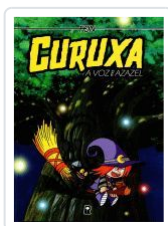
CURUXA. A VOZ DE AZAZEL. FONSO BARREIRO