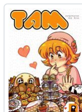
TAM ANEMONA DE RIO