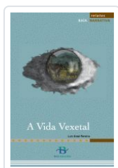
A VIDA VEXETAL (NOVELA) PEREIRA, LUIS XOSE