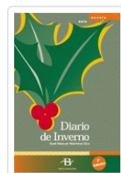
DIARIO DE INVERNO MARTINEZ OCA, X.M.