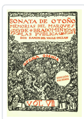
SONATA DE OTOÑO. MEMORIAS DEL MARQUES DE BRADOMIN RAMON DEL VALLE-INCLAN