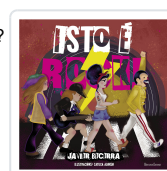
ISTO É ROCK! JAVIER BECERRA