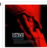
CARVALHO CALERO SEN FRONTEIRAS (INCLUE CD ) FOTOBIOGRAFIA AA.VV.